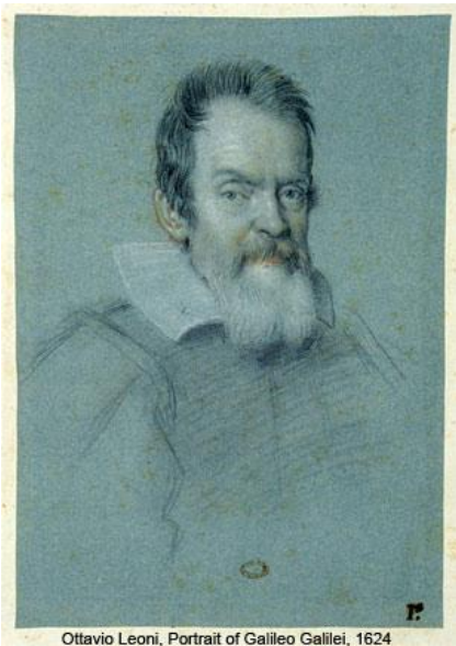
Ottavio Leoni, Portrait of Galileo Galilei, 1624

Galileo Galilei puede considerarse como el padre de las ciencias. Galileo investigó en campos tan variados del conocimiento, que aún hoy, 400 años después sigue siendo un científico reconocido por sus descubrimientos e investigaciones.