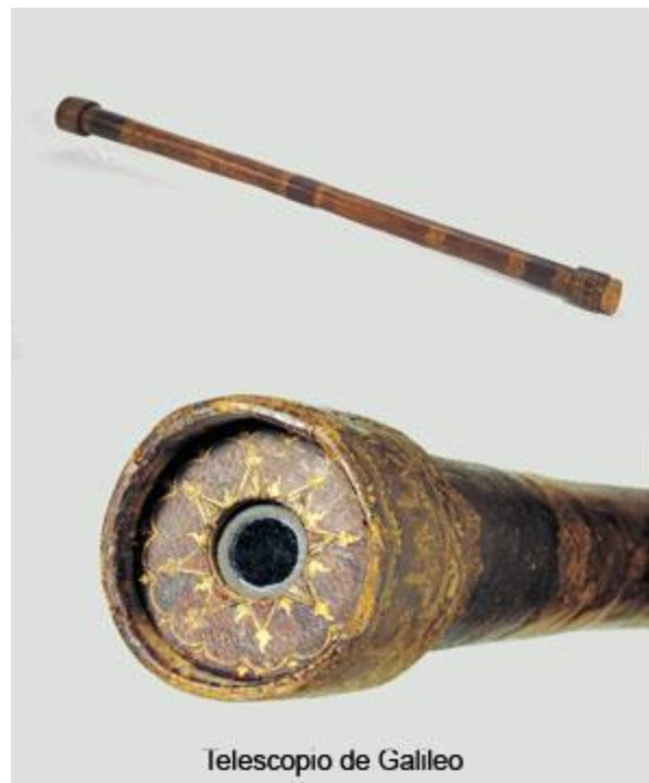
Telescopio de Galileo

Muy pronto se encontró sin dinero, con muchas deudas y tras la muerte de su padre, a cargo de la familia. El creía que podía inventar algo realmente original que pudiera vender, inventó el primer termómetro, el cual no tuvo mucha acogida y luego una brújula que podía utilizarse para dirigir los cañones en la guerra o para tomar medidas topográficas en el campo. Este invento le permitió hacerse a una buena cantidad de dinero y de fama.