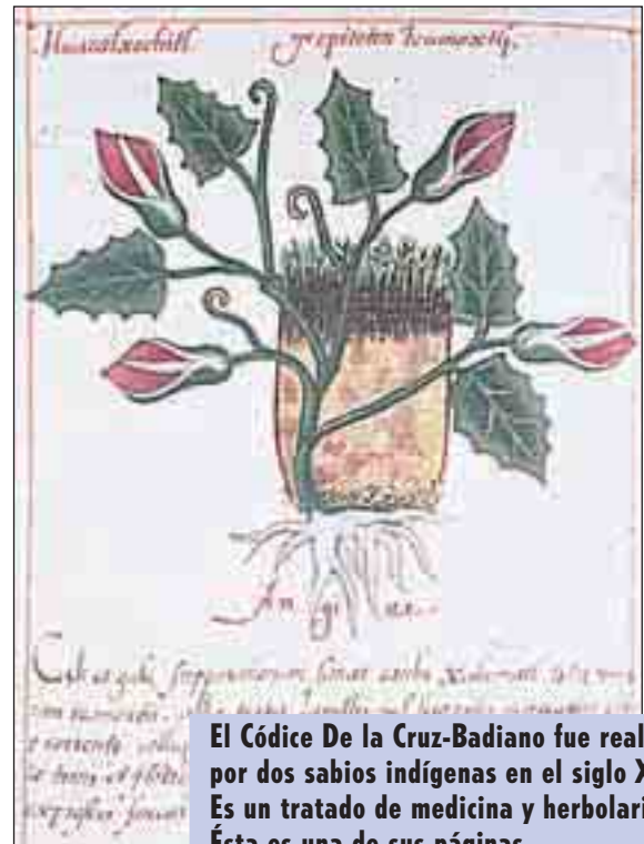
El Códice De la Cruz-Badiano fue realizado por dos sabios indígenas en el siglo XVI. Es un tratado de medicina y herbolaria. Ésta es una de sus páginas.

La arquitectura, la escultura, las joyas, los murales, la poesía de nuestros antepasados