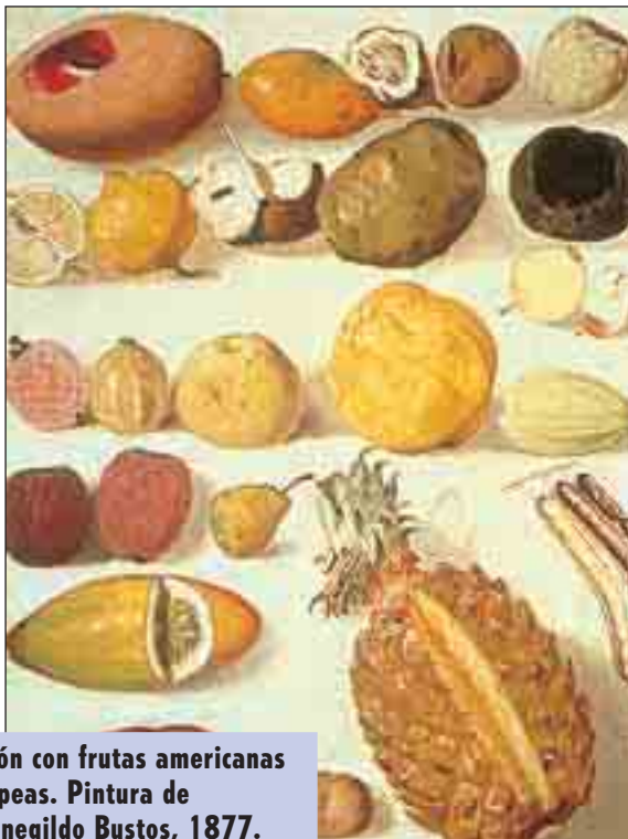
Bodegón con frutas americanas y europeas. Pintura de Hermenegildo Bustos, 1877.

Muchas de las cosas que comemos son herencia indígena, como las tortillas, los tamales, el atole, el pinole y el chocolate, como dulce o como bebida. El amaranto, preparado con miel, es esa golosina que llamamos alegría . El chicle, que se producía en la zona maya, dio origen a la goma de mascar, que hoy es una industria importante.