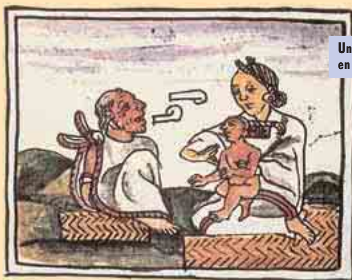
Un anciano aconseja a una madre joven, en una ilustración del Códice Florentino.

vuelve contra ellos; ya sólo grita, da alaridos. Ya no tiene rostro, ya no tiene corazón.