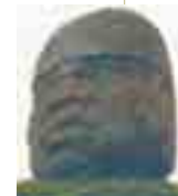
La Venta Tres Zapotes